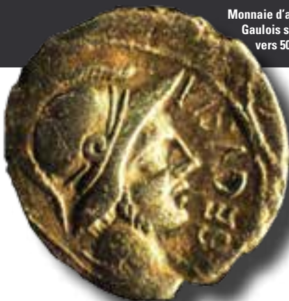
Monnaie d'argent des Gaulois ségusiaves vers 50-30 av. J.-C.