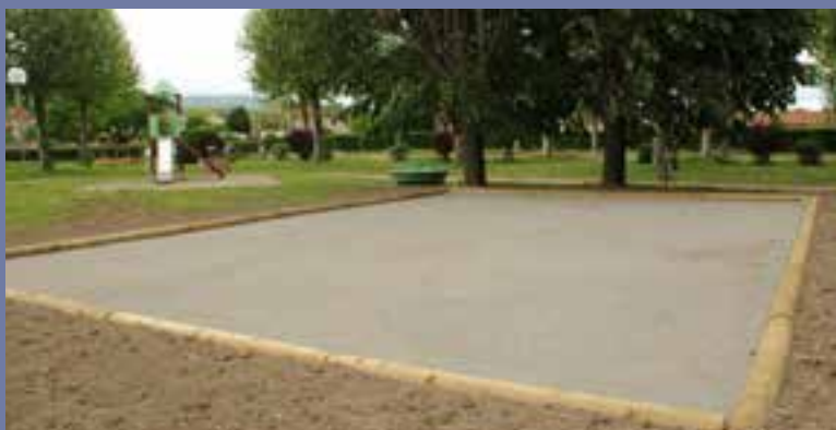
Un nouveau terrain de boules a été aménagé durant l'intersaison.