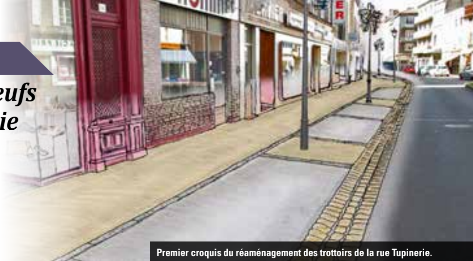
Premier croquis du réaménagement des trottoirs de la rue Tupinerie.

La commune va profiter de la trêve estivale pour mettre en accessibilité, tout en préservant sa capacité de stationnement, la principale artère commerçante de la ville. Un réaménagement étalé sur trois exercices budgétaires.