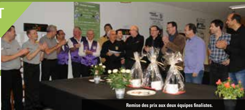
Remise des prix aux deux équipes finalistes.

L'installation du Club de Billard Montbrisonnais dans la Maison des associations lui a donné un nouvel élan !