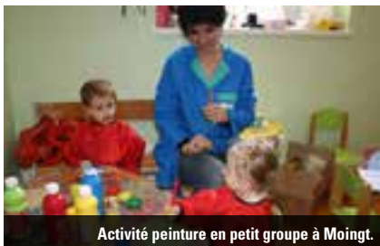
Activité peinture en petit groupe à Moingt.

aussi l'enfant selon des approches différentes qui leur permettent de répondre au mieux à l'ensemble de ses besoins.