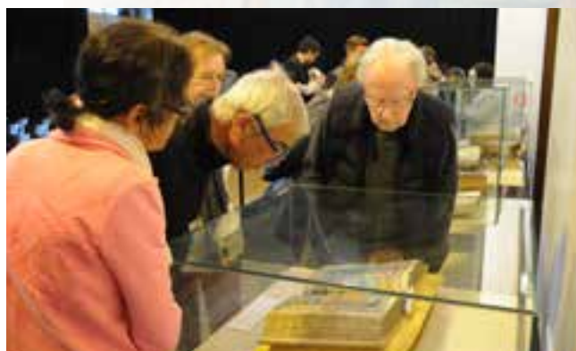
Les livres rares de Montbrison ont suscité un véritable intérêt auprès de toutes les générations.

des «incunables» (livres imprimés entre 1450 et 1501) dont le magnifique Missel Bourbon offert au chapitre de la collégiale par le cardinal Charles de Bourbon, une Bible imprimée en 1483 et d'autres livres rares dont l' Astrée, le roman écrit par Honoré d'Urfé au château de la Bâtie et une histoire du Forez en cinq volumes manuscrits. Des moments exceptionnels particulièrement appréciés.