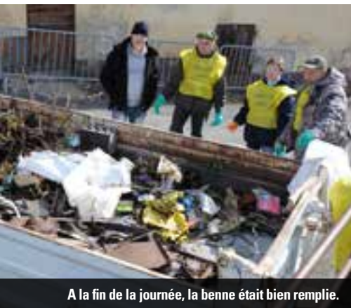
A la fin de la journée, la benne était bien remplie.