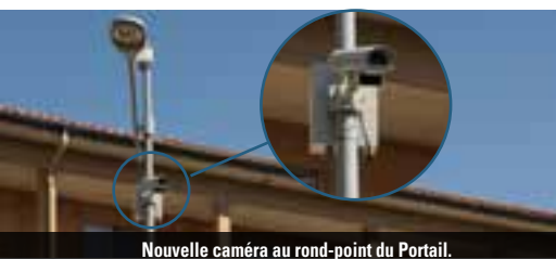
Nouvelle caméra au rond-point du Portail.