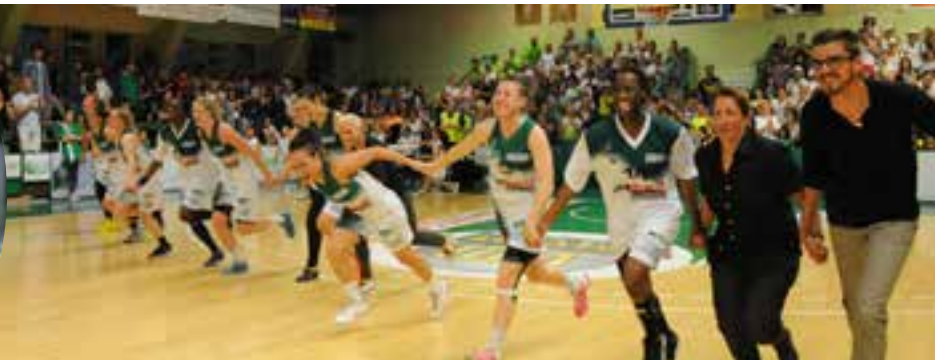
Scène de communion avec le public montrisonnais, les joueuses du BCMF en ont pris l'habitude depuis deux ans !