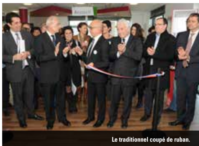
Le traditionnel coupé de ruban.

Mettant notamment à disposition des demandeurs d'emploi sept bornes d'accès internet et deux cabines téléphoniques, ces vastes locaux sont plus adaptés aux effectifs salariés de l'Agence (43 personnes) mais surtout au public important qui est amené à s'y rendre régulièrement (6484 demandeurs d'emploi au 30 novembre 2014).