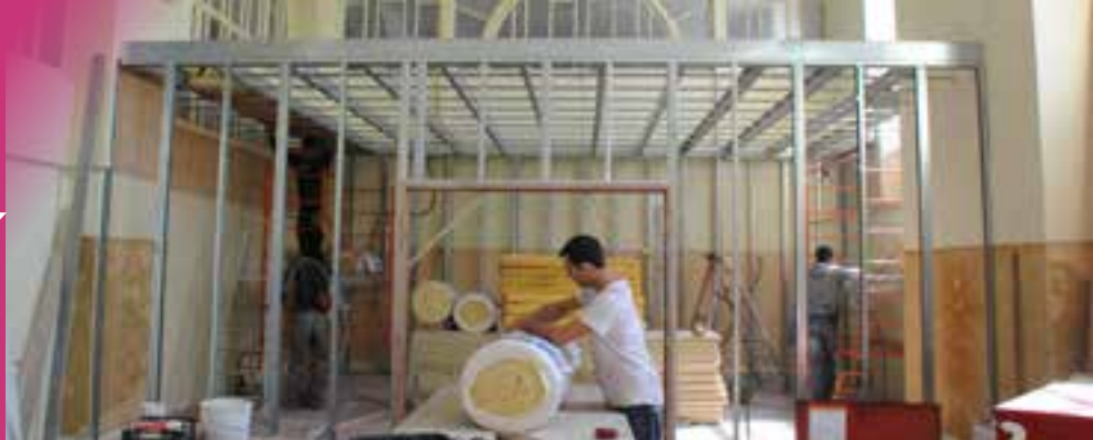
Les stagiaires ont réalisé un travail important dans le gymnase Guy IV, dont ce local de stockage de vêtements pour la Croix rouge française.

Jusqu'au 17 juillet, un nouveau groupe de stagiaires encadré sur le terrain par la Maison Familiale Rurale du Parc participe à un chantier école d'insertion piloté par la direction des affaires sociales.