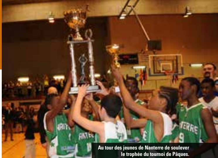
Au tour des jeunes de Nanterre de soulever le trophée du tournoi de Pâques.

Les joueurs du Forez ont opposé une belle résistance