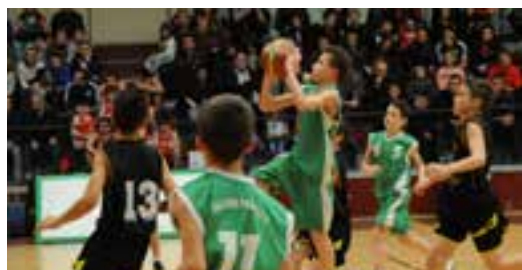
La finale du 8e tournoi Loire Forez a opposé Veauche et Perreux.