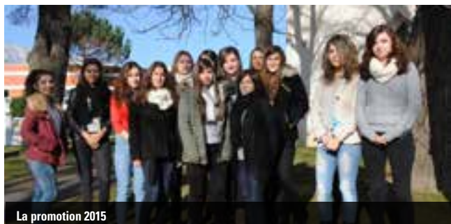
La promotion 2015

Cette initiation n'est pas seulement théorique. Ces jeunes filles ont donc également été accueillies dans les centres de loisirs et les crèches associatives.