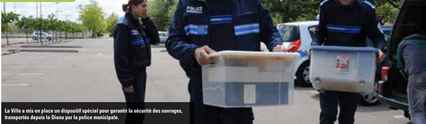
La Ville a mis en place un dispositif spécial pour garantir la sécurité des ouvrages, transportés depuis la Diana par la police municipale.