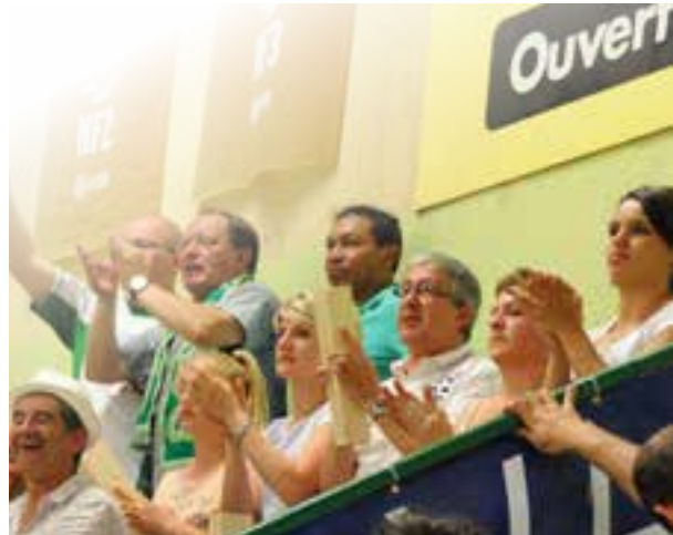
Les fidèles supporters sont aux anges, leur équipe a fait le trou dès le premier quart temps remporté 19 points à 8.