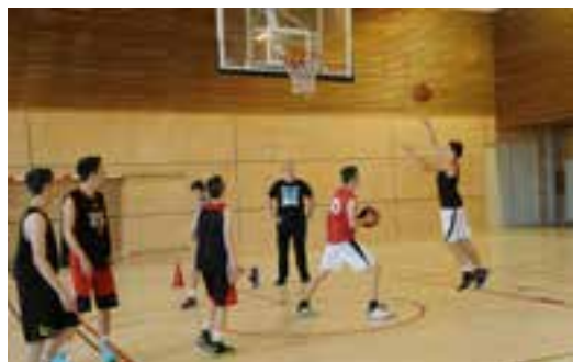
Grâce à l'ouverture de la section basket, les jeunes du BCM pourront cumuler six heures d'entraînement en plus chaque semaine.

Agés de 16 ans, les 10 filles et garçons admis dans cette nouvelle section en septembre bénéficieront de 6 heures d'entraînement supplémentaire par semaine, deux heures de préparation physique le mardi et deux heures de technique les jeudis et vendredis.