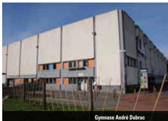
Gymnase André Dubruc