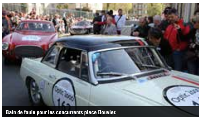
Bain de foule pour les concurrents place Bouvier.