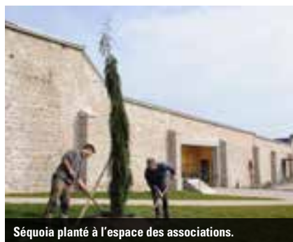
Séquoia planté à l'espace des associations.

un sur le massif de la rue Tupinerie et un autre, également autour de l'ancien stand de tir. Un jeune arbre à soie a fait son apparition au pont Saint-Jean.