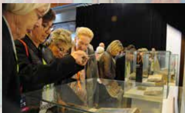
Le vendredi, les bénévoles des bibliothèques se sont régalés.