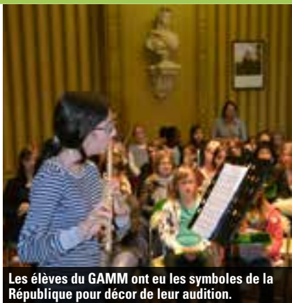
Les élèves du GAMM ont eu les symboles de la République pour décor de leur audition.