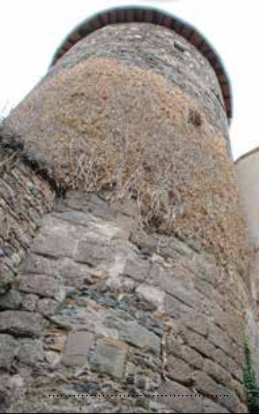
La Tour de la Barrière, vestige important des anciens remparts.

Samedi 19 et dimanche 20, 9h à 12h et 14h à 18h.