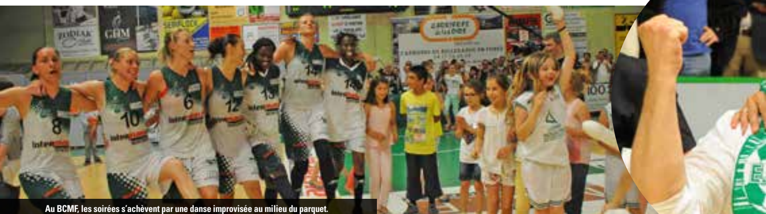
Au BCMF, les soirées s'achèvent par une danse improvisée au milieu du parquet.