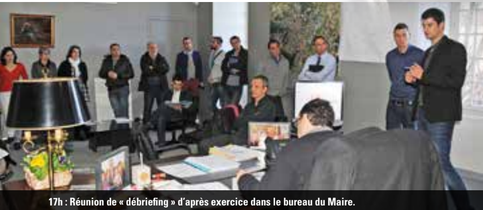
17h : Réunion de « débriefing » d'après exercice dans le bureau du Maire.

15h : Ouverture de la vanne du pont Saint-Jean par des agents du service des eaux.