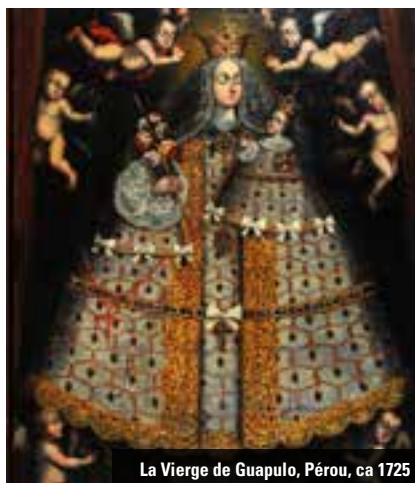
La Vierge de Guapulo, Pérou, ca 1725

Samedi à 17h, visite commentée sur le thème : « Couleurs et chocs des cultures à l'époque des Conquistadors »