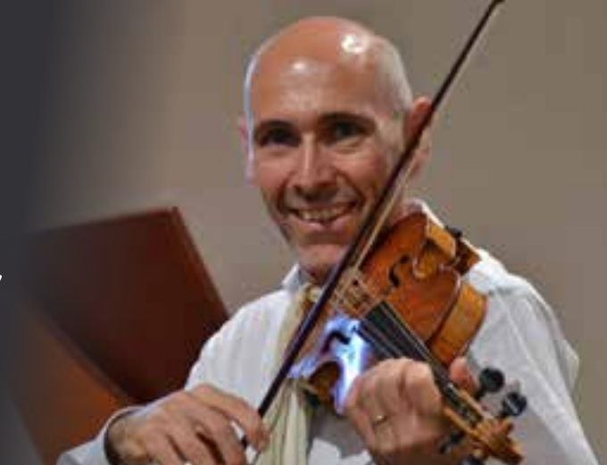
Habitué du Festival d'Ambronay, le violoniste Enrico Onofri dirigera les jeunes musiciens de l'Académie.

Lors de sa tournée estivale 2015, la 21 e Académie baroque européenne d'Ambronay dans l'Ain fera une halte à Montbrison pour présenter «Violino Fantastico», panorama musical associant des compositeurs baroques italiens et les piliers du répertoire allemand.