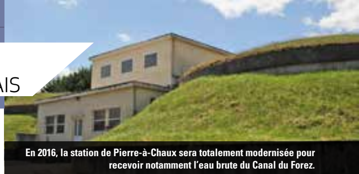
En 2016, la station de Pierre-à-Chaux sera totalement modernisée pour recevoir notamment l'eau brute du Canal du Forez.