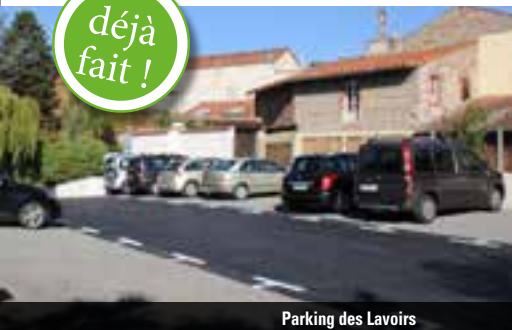
Parking des Lavoirs