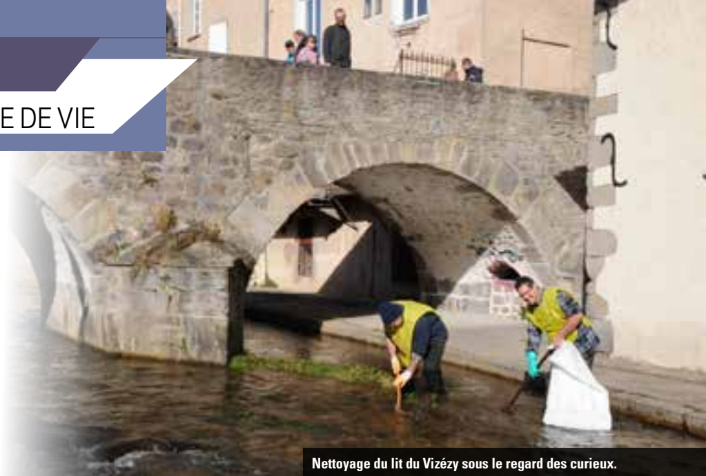
Nettoyage du lit du Vizézy sous le regard des curieux.