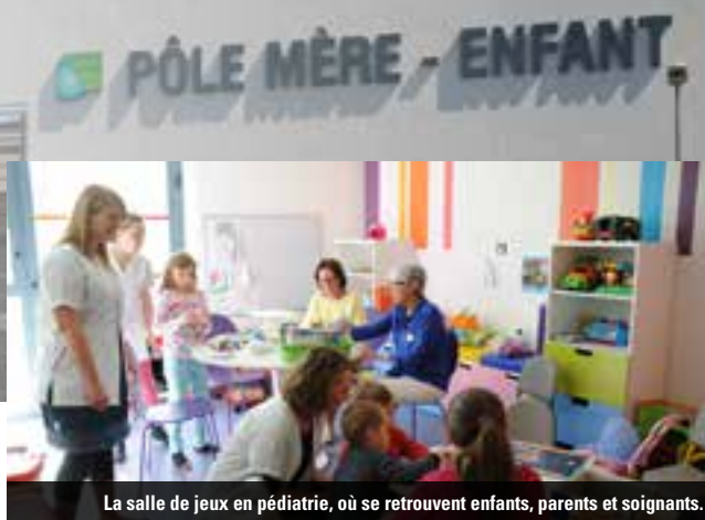
La salle de jeux en pédiatrie, où se retrouvent enfants, parents et soignants.

Le 27 mai 2015, jour anniversaire de l'ouverture, le personnel de la maternité et du service pédiatrie s'est mobilisé pour faire découvrir un équipement moderne.