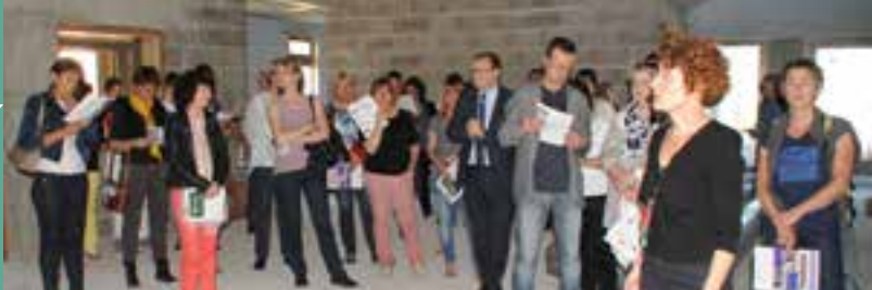
Les enseignants et responsables de la direction Education, jeunesse et sports notamment ont été invités à une découverte de leur futur outil de travail.

Les 28 mai et 1 er juin, la Ville a organisé deux visites du chantier de construction de la future école Brillié de 14 classes. Tous ont pu constater la bonne avancée du chantier pour une ouverture programmée en septembre 2016.