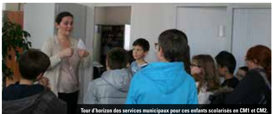
Tour d'horizon des services municipaux pour ces enfants scolarisés en CM1 et CM2.