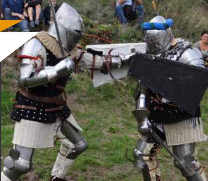
des combats à pied seront organisés dans le clos des quatre vents, au sommet du Calvaire.

En lien avec les associations, la Ville de Montbrison a élaboré un riche programme d'animations. Voici un avant-goût des moments forts.