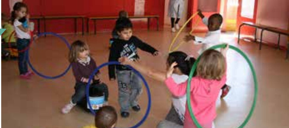
Dans la salle d'évolution à Beauregard, un franc succès pour le jeu avec les cerceaux !

Il faut dire que les équipes maîtrisent bien leur sujet. Auxiliaire de puériculture, titulaire du CAP petite enfance, ou éducatrices de jeunes enfants, elles sont toutes des professionnelles diplômées de la petite enfance. Mais elles abordent