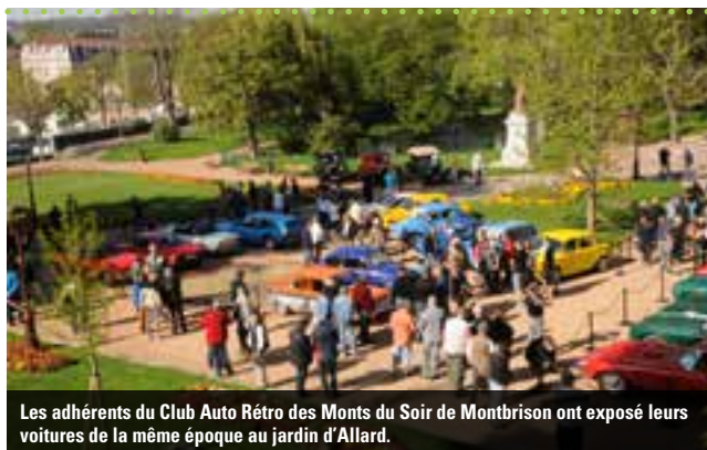
Les adhérents du Club Auto Rétro des Monts du Soir de Montbrison ont exposé leurs voitures de la même époque au jardin d'Allard.

Durant quatre heures, les appareils photos n'ont cessé de crépiter sur la place Bouvier ! Qu'il s'agisse de modèles Porsche, Ferrari, Jaguar, BMW, Alfa Roméo, Lotus, Ford, Triumph, sans oublier l'indémodable Alpine Renault, ces 200 bolides puissants ont animé la course automobile dans les années 50-70. Le passage du Tour auto a donc réveillé des souvenirs dans la tête des amateurs.