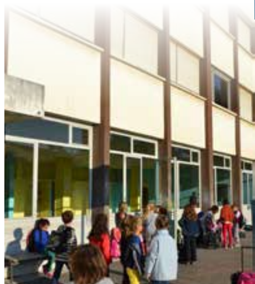
Travaux de rénovation à l'école Chemin rouge.