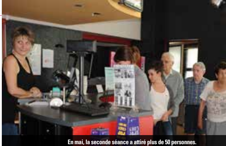
En mai, la seconde séance a attiré plus de 50 personnes.

Le film choisi par l'OMPAR et le cinéma Rex sera «Les Optimistes», sorti le 29 avril 2015, qui raconte l'histoire d'une équipe de volley composée de joueuses âgées... de 66 à 98 ans!