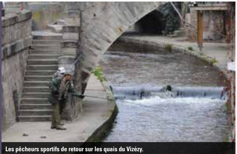
Les pêcheurs sportifs de retour sur les quais du Vizézy.

Du 14 mars au 3 e dimanche de septembre, un parcours de pêche « no-kill » (littéralement « sans tuer ») a été ouvert dans ce secteur du Vizézy sur deux tronçons (du stade de Savigneux au pont Saint-Jean ; du pont Saint-Jean à la passerelle du quai des eaux minérales). Les titulaires de la carte de pêche (exclusivement !) sont autorisés à pratiquer leur passion, mais à condition de relâcher le poisson immédiatement.