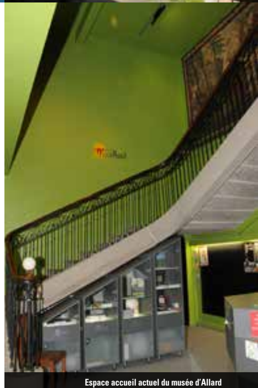
Espace accueil actuel du musée d'Allard