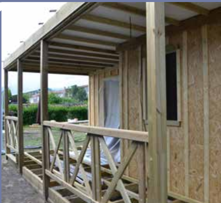
Trois chalets sont arrivés en pièces détachées début juin pour être montés sur place.

Avant le lancement de la saison estivale, les services techniques de la Ville sont aussi intervenus sur le site pour des aménagements de fond, lesquels ont consisté à installer un nouvel éclairage extérieur sur une partie du terrain, à raccorder les chalets aux réseaux d'assainissement, électrique et de téléphonie et à aménager un terrain de boules digne de ce nom, endroit stratégique pour tout camping qui entend entretenir et développer la convivialité entre vacanciers !