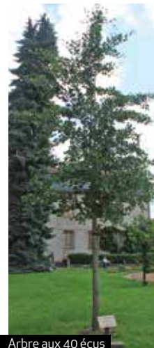
Arbre aux 40 écus

Aménagement de l'entrée du cimetière. La ville a entrepris une démarche de rénovation des tombes à forte valeur patrimoniale dans le cimetière. A cette occasion, il a été décidé que le cimetière méritait d'être rénové et embelli. Les travaux ont débuté cette année avec la reprise du mur d'entrée sur lequel des ouvertures (des fenêtres avec des grilles) sont créées actuellement pour laisser entrevoir le cimetière. Parallèlement, tout l'espace à l'entrée du cimetière va être repris, avec la création d'un columbarium, d'espaces de repos, et de recueillement et d'un espace paysager avec un chêne palustré, des rosiers, des photinias, des forsythias, et des graminées.