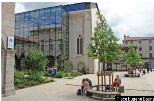
Place Eugène Baune

Plus récemment, c'est la place Bouvier agrandie qui a bénéficié de la plantation d'une dizaine de "gleditsia" (féviers) toujours dans une volonté de diversification, pour non seulement embellir la ville, mais aussi réduire les nuisances des "tigres du platane", cet insecte, qui bien qu'innocent, tombe sur les passants et s'infiltré même dans les maisons des riverains.