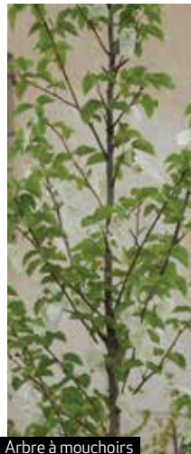
Arbre à mouchoirs