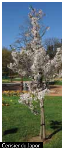
Cerisier du Japon

Respirer à Moingt. Derrière la tour, la démolition de maisons vétustes a laissé la place à un îlot destiné à être un espace de respiration et de luminosité pour le voisinage.