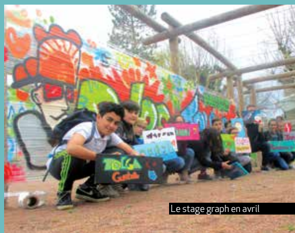
Le stage graph en avril

Renseignements : Espace Jeunes 2 rue Fernand Léger 06 47 62 29 87 Facebook : espace jeunes montbrison.