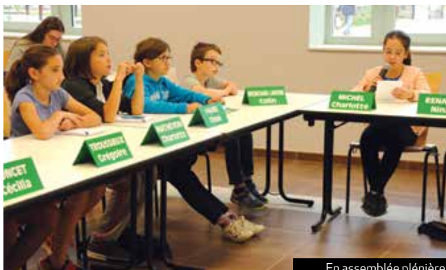
En assemblée plénière, les enfants ont présenté leur travail de l'année devant les élus impressionnés.