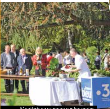
Montbrison rayonne sur les ondes