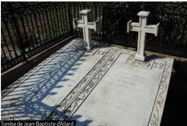
Tombe de Jean-Baptiste d'Allard