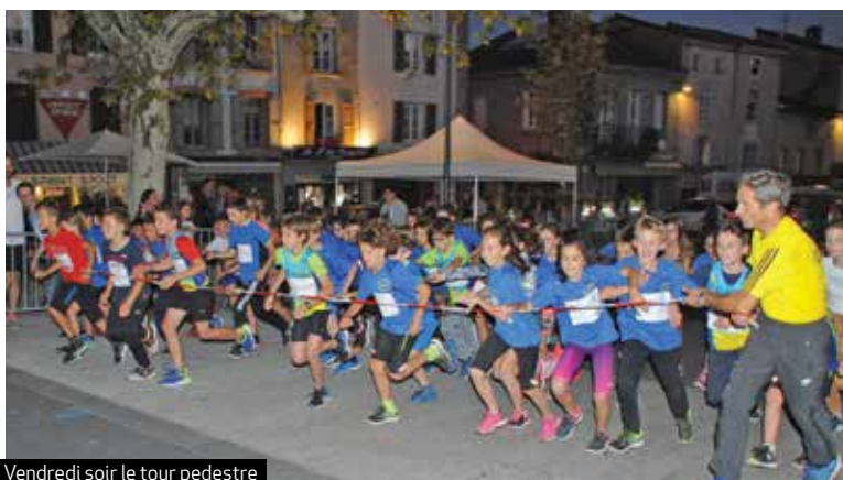
Vendredi soir le tour pedestre