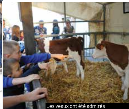
Les veaux ont été admirés