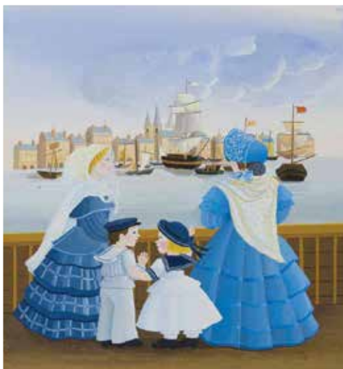
© Daniele Bour - Les malheurs de Sophie