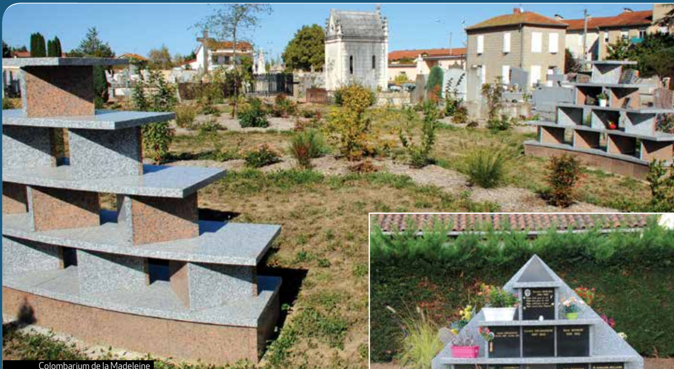
Colombarium de la Madeleine