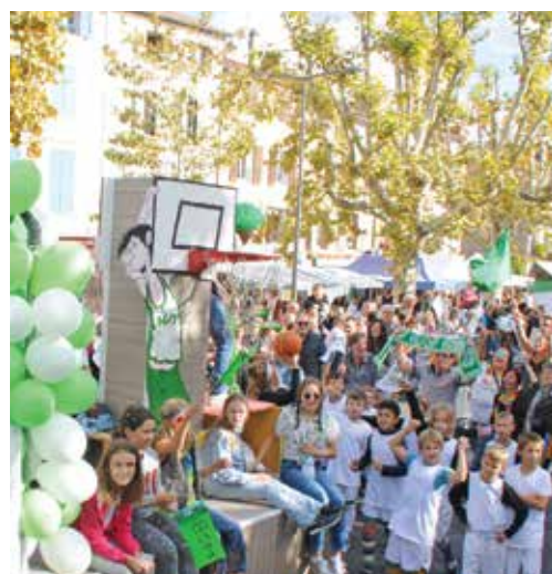
La jeune génération de l'ADN montbrisonnais, le basket

Le ciel a tenu. Après la journée quasiment caniculaire de samedi, on redoutait la pluie annoncée pour dimanche. Elle a arrosé le Forez durant la nuit, laissant ainsi aux milliers de visiteurs, d'excellentes conditions météo pour la journée de dimanche. De flânerie gourmande en spectacle d'un corso haut en couleurs, la foule était au rendez-vous, des exposants, des restaurateurs de la Loire, et des sites du goût. Elle a particulièrement apprécié les démonstrations et explications autour des vaches dont le lait fait la fourme. Les 56 èmes journées de la fourme de Montbrison et des côtes du Forez ont été à la hauteur de leur réputation. Avec, pour la première fois une nouveauté médiatique : la présence, samedi matin, de France 3 qui a réalisé l'émission "Goûtons voir" et le journal de la mi-journée en direct du jardin d'Allard. La télé en complément de la radio, car depuis trois ans la présence de France Bleu Saint-Etienne Loire, durant tout le week-end, contribue largement à l'animation.