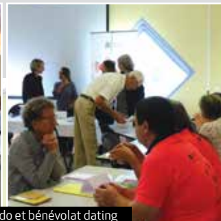
Démonstration de judo et bénévolat dating