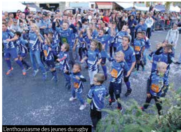
L'enthousiasme des jeunes du rugby