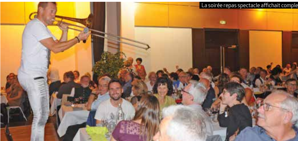
La soirée repas spectacle affichait complet