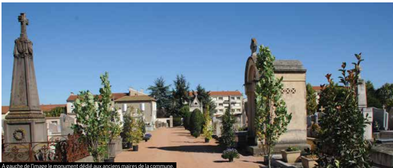
A gauche de l'image le monument dédié aux anciens maires de la commune.