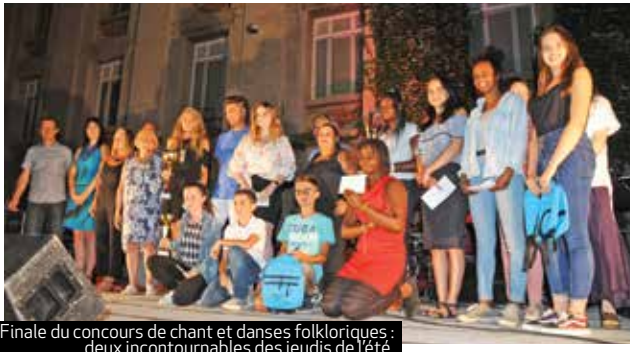
Finale du concours de chant et danses folkloriques : deux incontournables des jeudis de l'été.