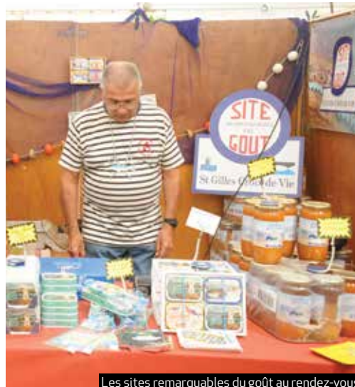
Les sites remarquables du goût au rendez-vous