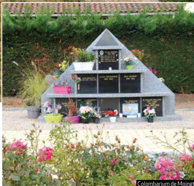
Colombarium de Moingt