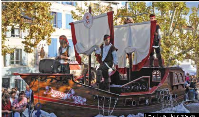
Les arts martiaux en vague