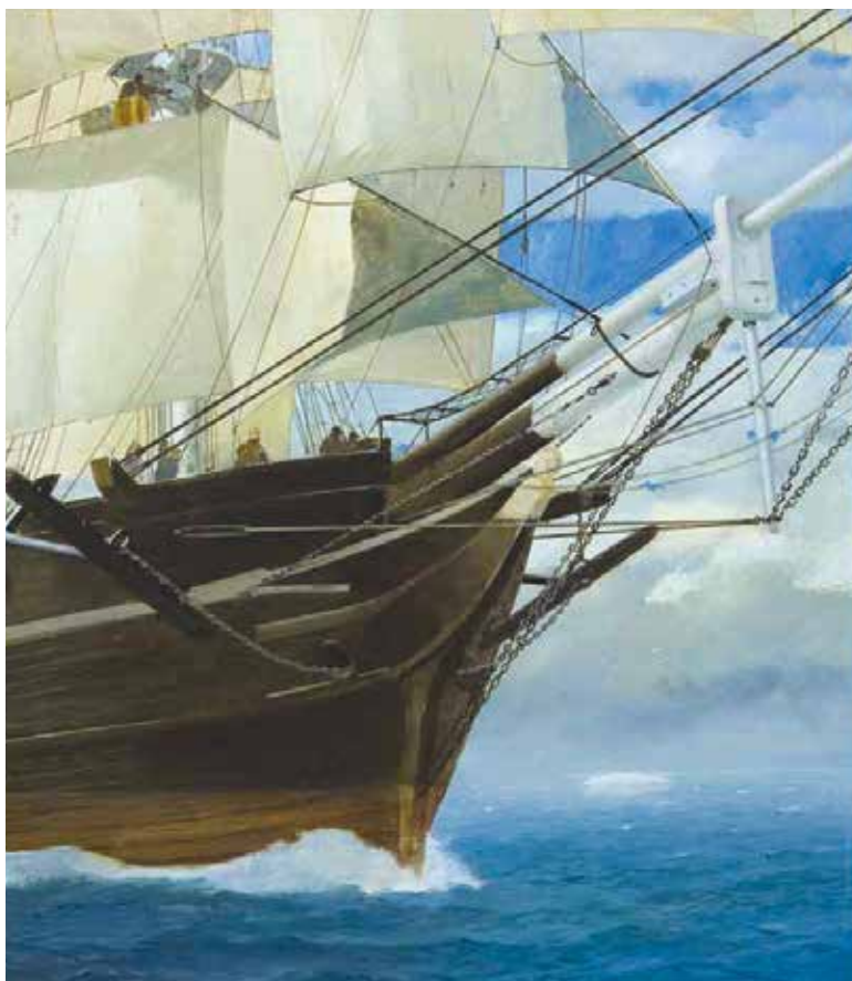
© James Prunier - Moby Dick

L'exposition "Voyages" sera visible du 13 novembre 2018 au 27 janvier 2019.