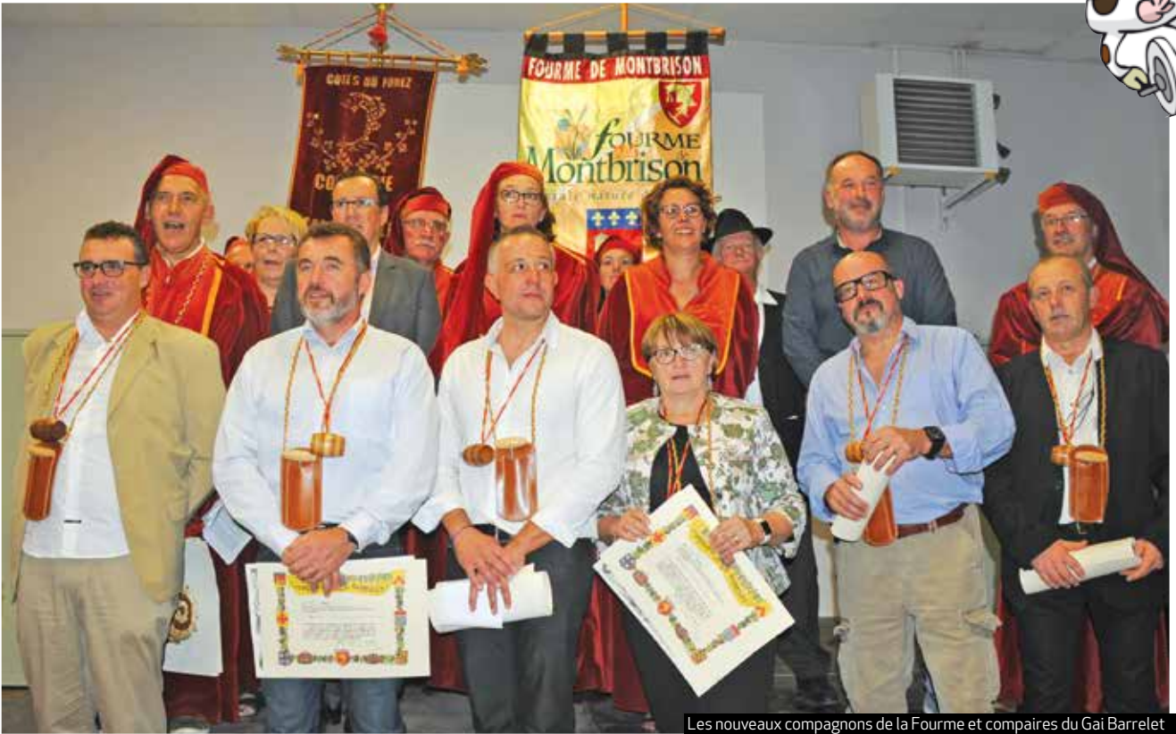
Les nouveaux compagnons de la Fourme et compaires du Gai Barrelet