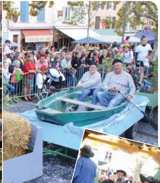
Savigneux en barque