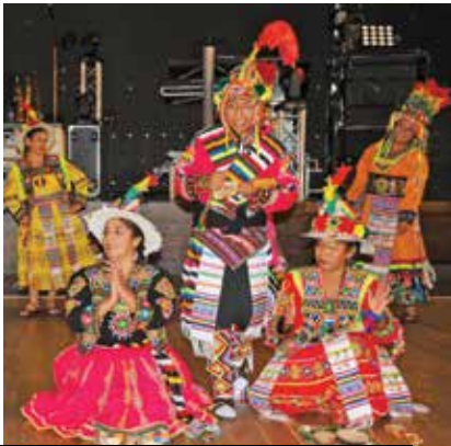
L'Amérique avec le groupe folklorique de Bolivie