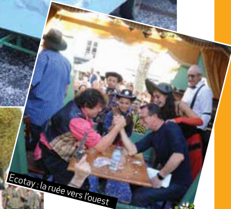
Ecotay : la ruée vers l'ouest