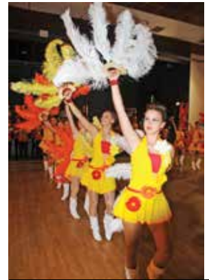
L'Europe avec les majorettes de Budapest