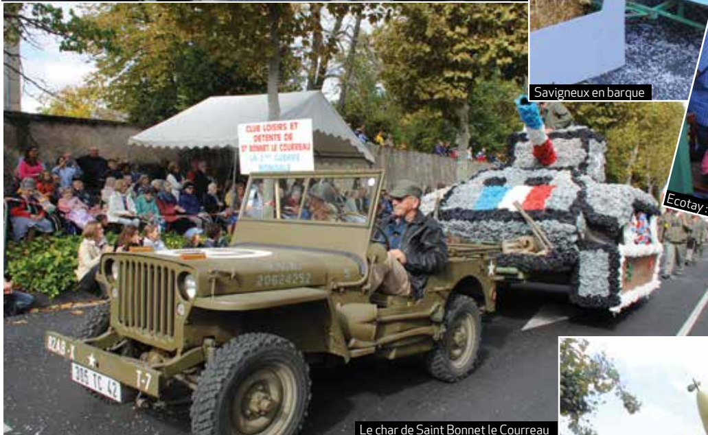
Le char de Saint Bonnet le Courreau