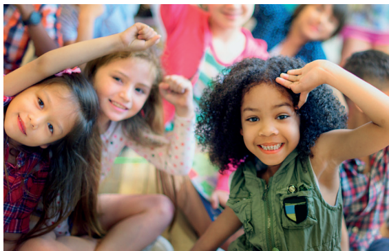
Conception service communication, Ville de Montbrison - Juillet 2022