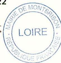
Christophe BAZILE Maire de Montbrison Président de Loire Forez agglomération

La présente décision, à supposer que celle-ci fasse grief, peut faire l'objet, dans un délai de deux mois à compter de sa notification ou de sa publication et/ou de son affichage, d'un recours contentieux auprès du Tribunal administratif de Lyon (Palais des Juridictions administratives, 184, rue Duguesclin, 69433 Lyon Cedex 03) et sur le site www.telerecours.fr ou d'un recours gracieux auprès de la commune Montbrison, Direction Générale, CS 50179, 42 605 MONTBRISON CEDEX étant précisé que celle-ci dispose alors d'un délai de deux mois pour répondre. Un silence de deux mois vaut alors décision implicite de rejet. La décision ainsi prise, pourra elle-même être déférée au tribunal administratif dans un délai de deux mois. Conformément aux termes de l'article R. 421-7 du Code de justice Administrative, sauf les requérants qui usent de la faculté prévue par les lois spéciales de déposer leurs requêtes auprès des services du représentant de l'Etat ou de son délégué dans les arrondissements, les subdivisions ou les circonscriptions administratives, les personnes résidant outre-mer et à l'étranger disposent d'un délai supplémentaire de distance de respectivement un et deux mois pour saisir le Tribunal.