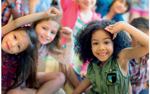
Conception service communication, Ville de Montbrison - Janvier 2023