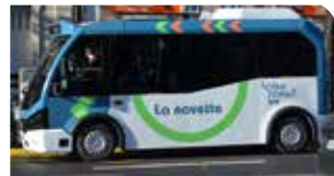
Loire forez agglomération

Le centre social en coordination avec Loire Forez agglomération propose de vous faire «apprivoiser» la navette urbaine de la commune.