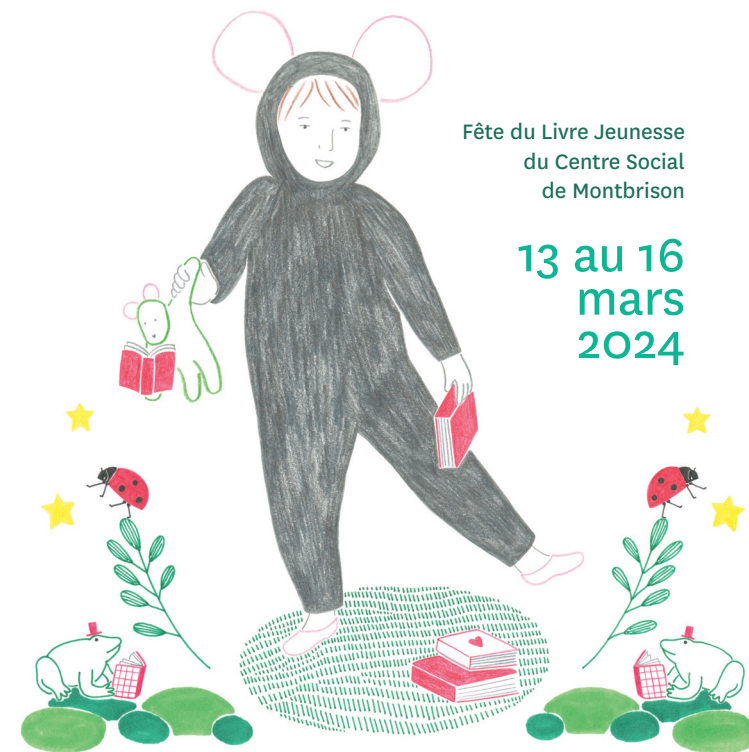
Illustration Audrey Collejo - Impression : IPM Montbrison - Ne pas jeter sur la voie publique