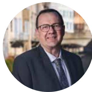
Christophe Bazile Maire de Montbrison