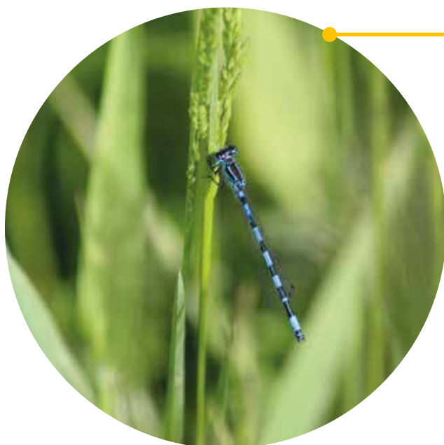
"Coenagrion mercuriale (Agrion de mercure)"

Ensemble, économisons l'eau : ça coule de source !