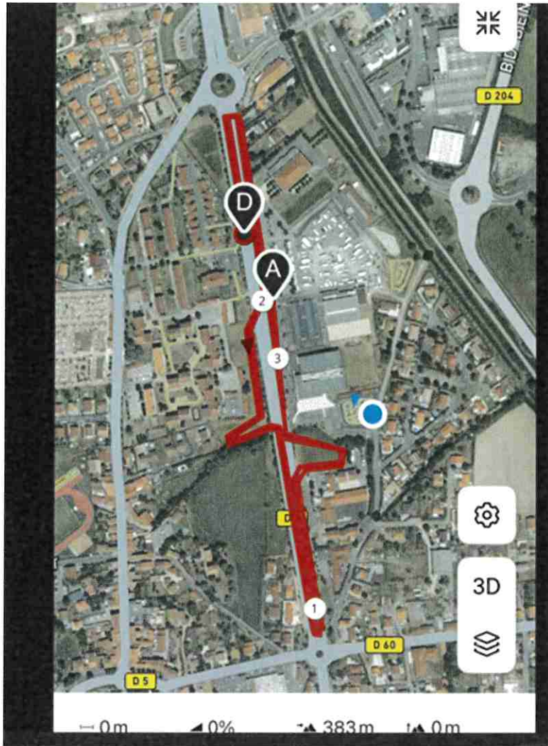
Parcours FUN RUN – le Marathon de la Bière – samedi 23/05/26